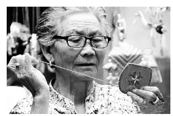
山东民间艺人制作端午香囊

明清南方端午节俗主要有避瘟与竞渡。首先看端午避瘟去毒的节俗，明代南京，五月初五日，同样有各种避毒措施，家家庭院悬道士朱符，人人佩戴五色绒线符牌，门户上用丝缕系一个独蒜，并用彩帛、通草制作五毒物：蛇、蝎、蜈蚣、蜘蛛、蜈蚣，然后连接于大艾叶上，悬挂于门。（顾起元《客座赘语》卷四）兰汤沐浴是端午传统节俗，明时，兰汤不易得，人们五日日午时取五色草煎汤沐浴。 在杭州，端午节称为“天中节”，人们以五彩丝系粽，以彩绒线编织经筒符袋，互相馈赠。僧道给施主送经筒符，辟恶灵符；医家给平时来往多的人送香囊、雄黄、乌发油香。家家买菖蒲艾，植之堂中，标以五色花纸，贴画虎蝎或天师之象。或朱书“五月五日天中节，赤口白舌尽消灭”之句，贴在门楹之间。有的书写“仪方”二字，倒贴于楹，以避蛇蝎。（田汝成《西湖游览志余》第二十卷，照朝乐事） 清代苏州五月初一，大户人家将道院赠送的天师符贴在厅中，以“镇恶”，肃拜烧香，至六月初一，始焚