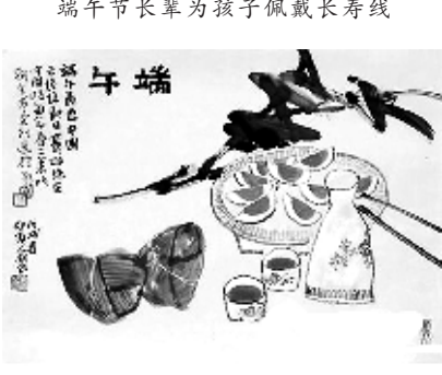
喝雄黄酒、吃粽子、挂艾草等端午习俗流传至今。